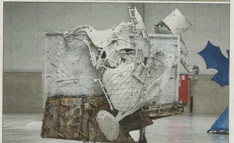
L'exposition au Wandhaff privilégie la peinture tandis que celle de Foetz s'intéresse particulièrement à la sculpture.