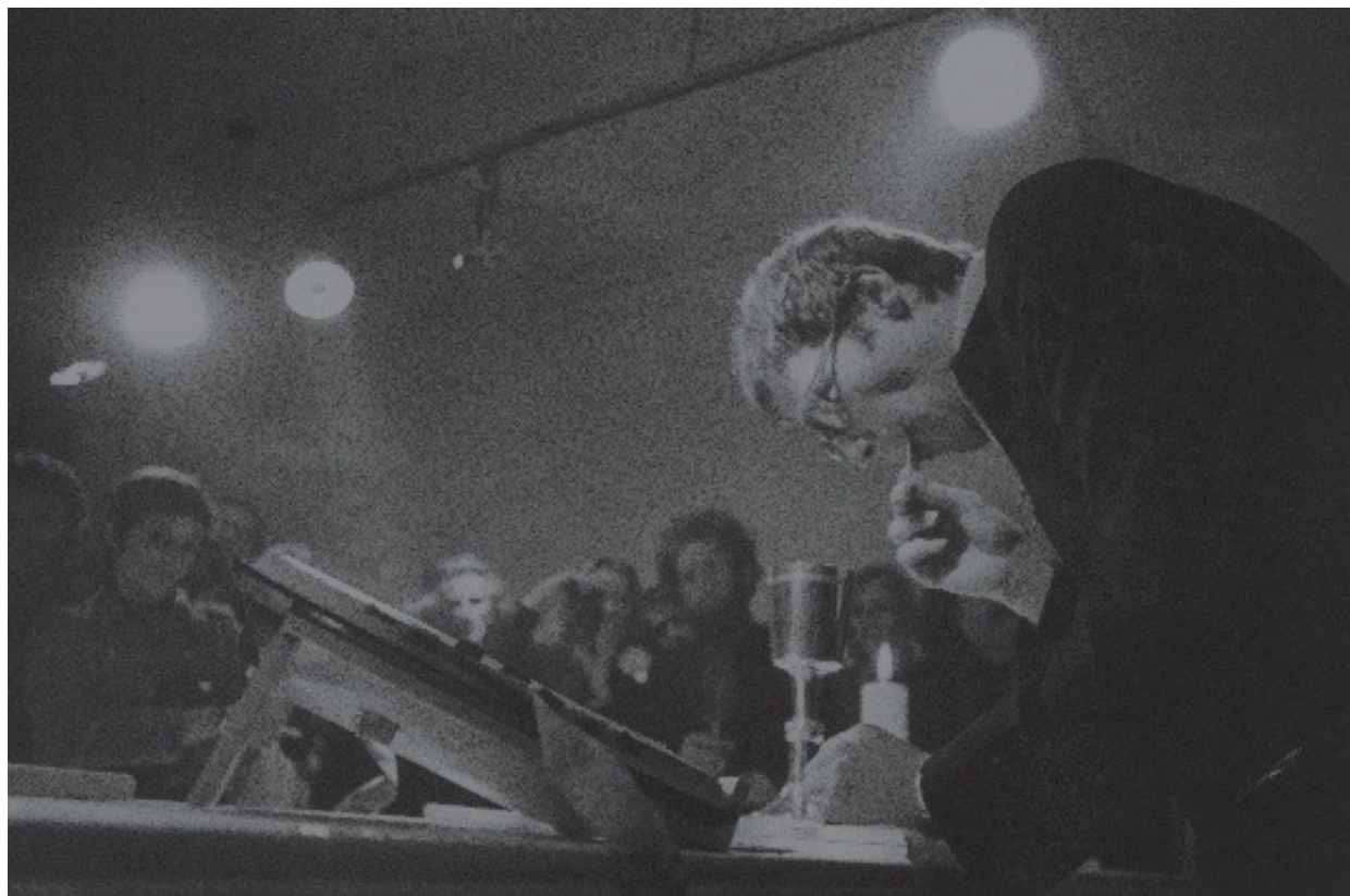
Messe pour un corps, Michel Journiac, 1969

Apprenez-en plus et faites le tour du monde des arts à travers les siècles avec L'Histoire de l'Art pour les nullissimes par Alexia Guggémos, aux Éditions Pour les nuls.