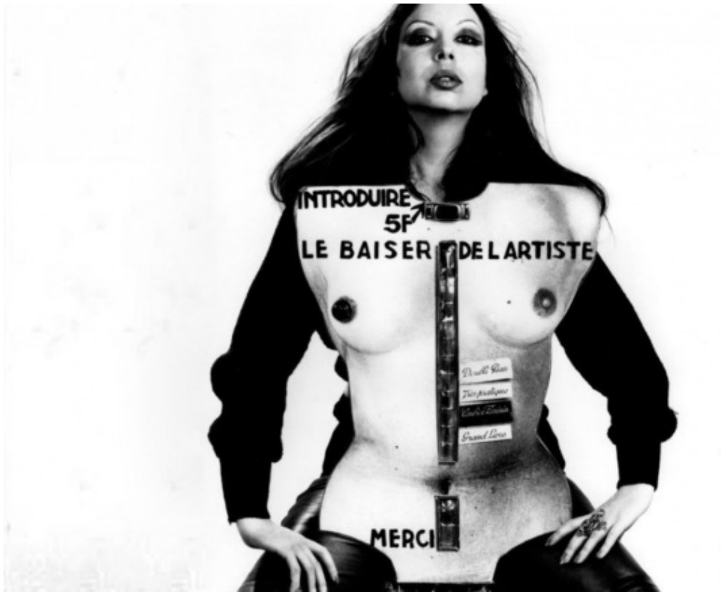
Le Baiser de l'artiste, ORLAN, 1977 © Adagp, Paris