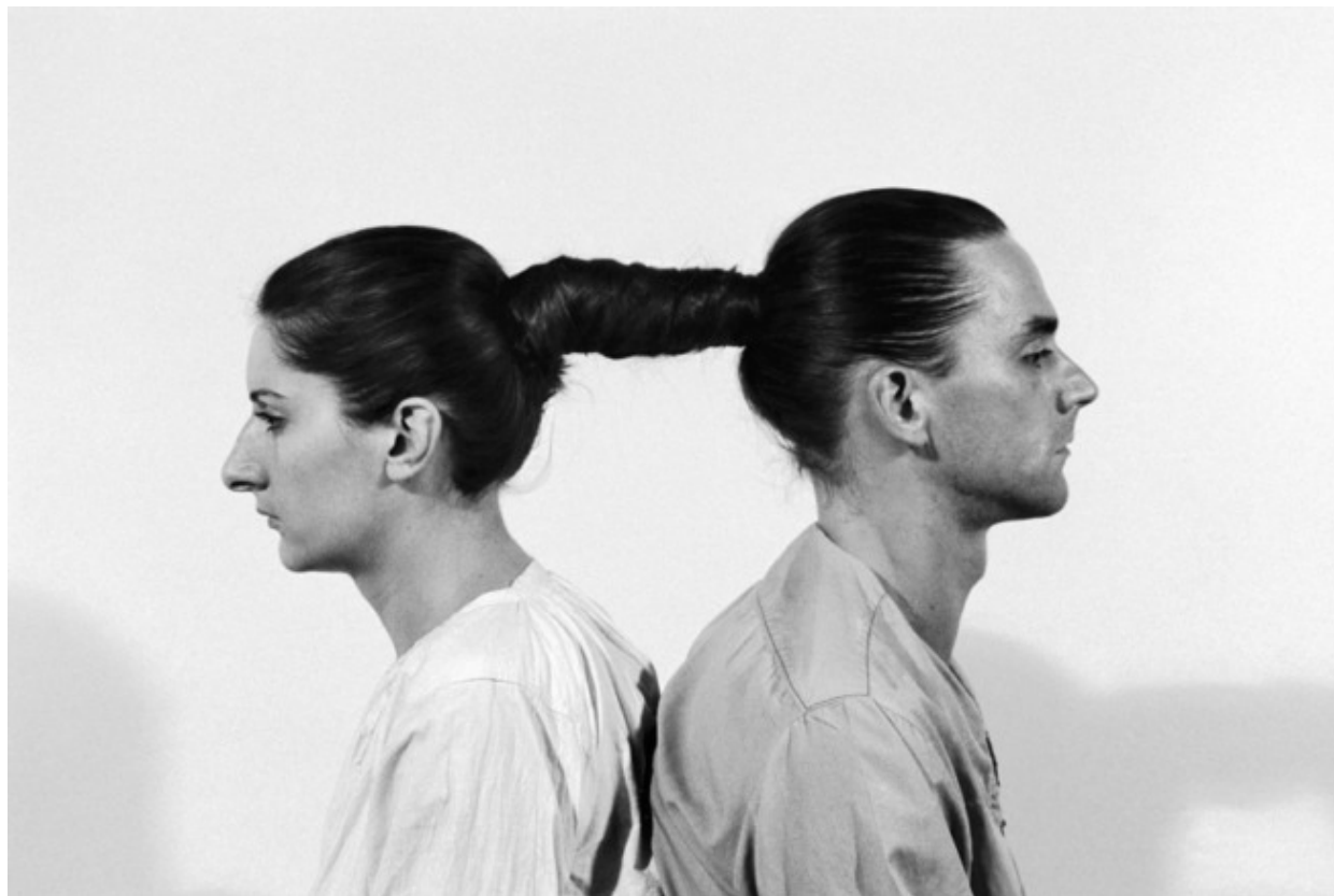
Relation in Time, Marina Abramovic et Ulay, 1977, Museum of Modern Art, New York.

kilomètres de la muraille de Chine, le duo a multiplié les expériences extrêmes. Ainsi, en 1977, assis dos à dos, cheveux liés pendant 16 heures dans le studio G7 de Bologne (Italie), ils ont admis le public à la 17 e heure et sont restés une heure de plus sans bouger.