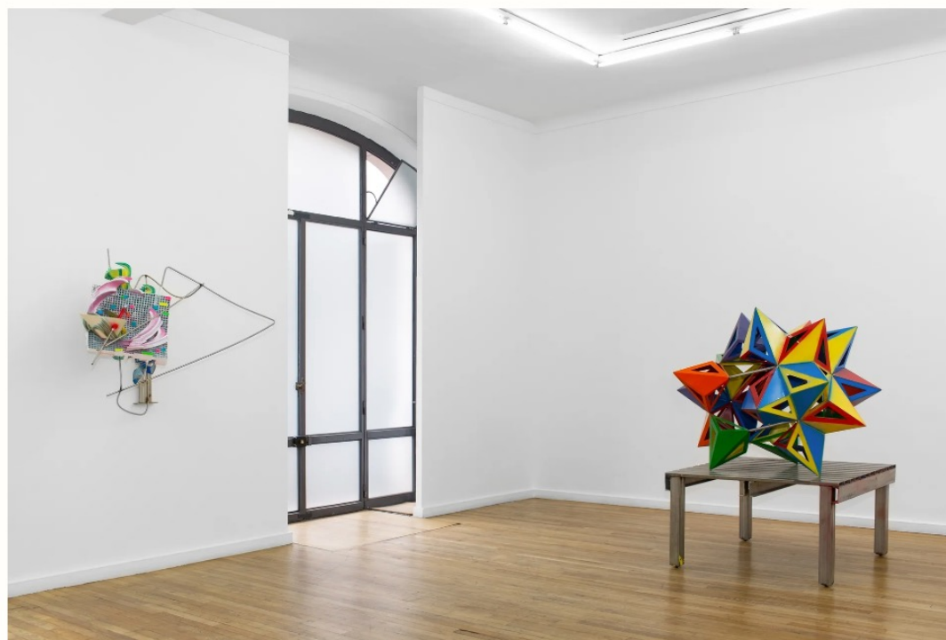
Vue de l'exposition Frank Stella à la galerie Ceysson & Bénétière à Paris.