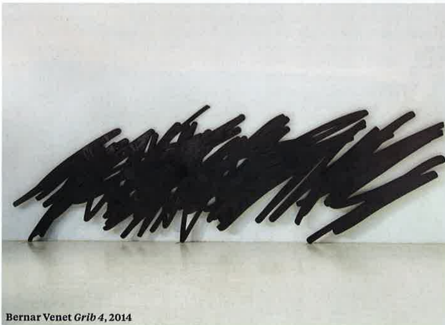
Bernar Venet Grib 4, 2014