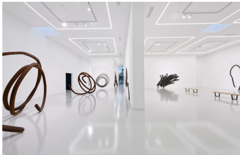
L'exposition inaugurale de la dernière galerie Ceysson & Bénétière, ouverte à Saint-Étienne, présente des œuvres monumentales de Bernar Venet.