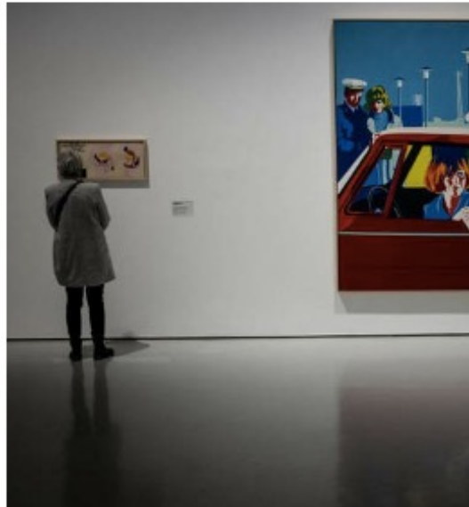
"Le Dernier whisky" de Bernard Rancillac, présenté lors de l'exposition intitulée "Double Je" qui a ouvert ses portes le 20 novembre dernier au Musée d'Art Moderne et Contemporain de Saint-Étienne.